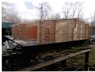
фотографије локације и објекта

Потребно је извршити контролу простора и спровести мјере из ваше надлежности.