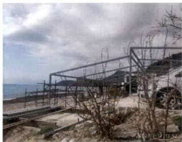
Fotografije radova i lokacije

Izvršenim obilaskom prostora opštine Bar, konstatovali smo izvođenje građevinskih radova na lokalitetu Sutomore, na prostoru istočno od stalnog objekta- nekadašnji restoran "Tri duda", postupajući po ponovnoj prijavi da su na navedenoj lokaciji izvode radovi. Obilaskom terena konstatovano je da se na kat parceli 2116 KO Sutomore, izvode radovi postavljanja metalne konstrukcije za tendu, na dijelu koji je u funkciji terase restorana "Tri duda", površine cca 260m 2 . Navedeni objekat "Tri duda" je u el.evidenciji katastra nepokretnosti stalni objekat, površine 532 m 2 , namjene restoran, sa dvorištem- površine 258 m 2 , na kat parceli 2116 KO Sutomore, u državnom vlasništvu.