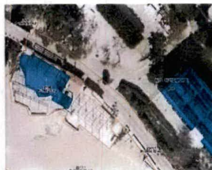
Fotografije radova i lokacije