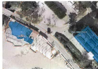
skica sa Geoportala UZN.

Ističemo da smo dana 31.01.2020. godine Direktoratu za inspekcijske poslove i licenciranje prosljedili Zahtjev za kontrolu prostora, broj 0103-291/6-1 zbog konstatovanja izvođenja građevinskih radova nasipanja novog sloja betona, na već postojeću betonsku podlogu.