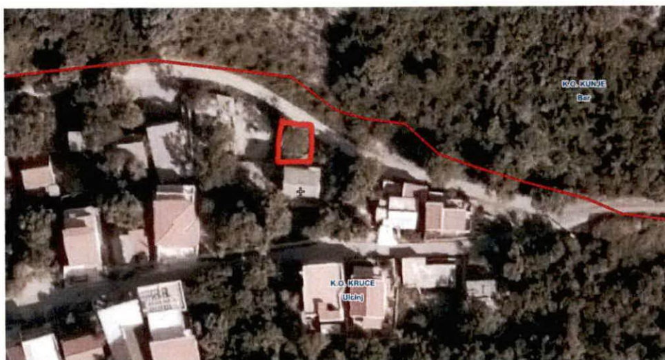
Obilježena lokacija na kojem se izvode pomenuti radovi ( kat.par. 1043 K.O. Kruče ).