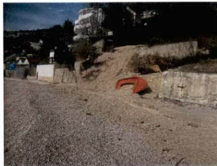
Fotografije kupališta nakon nasipanja

- na lokacija Kruče na kat.par. 1043/1 i 1043/2, K.O. Kruče koje se po dostupnim podacima Uprave za nekretnine, vode kao svojina Todorović Krsta Ljiljane iz Beograda izvode se građevinski radovi bez odobrenja na dogradnji pomoćnog čvrstog objekta, na način da je na betonskoj ploči postojećeg objekta izgrađen objekat površine cca. 8 m 2 .