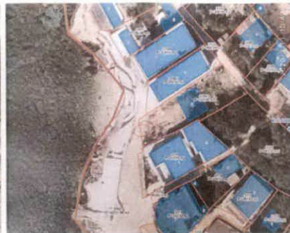
fotografije lokacije i