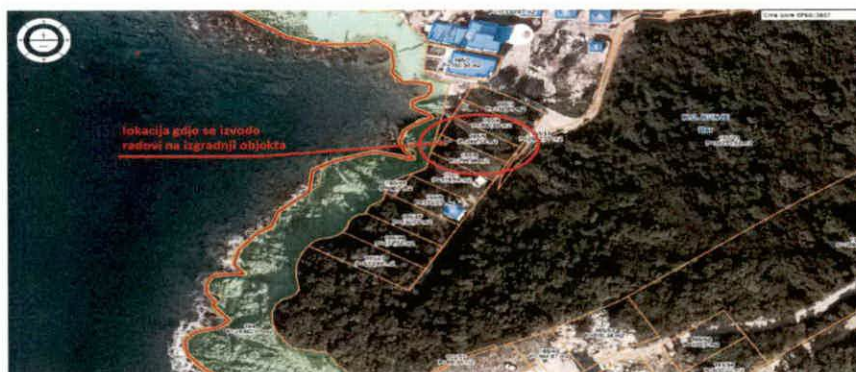
izvod mape sa Geoprtala UZN