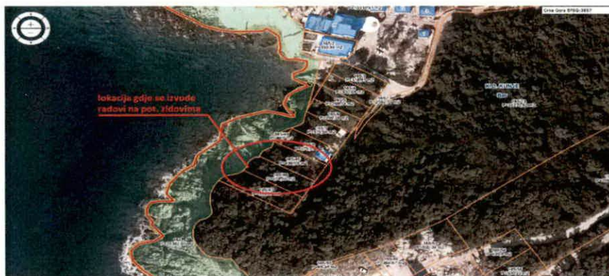
izvod mape sa Geoprtala UZN

Potrebno je izvršiti kontrolu prostora i sprovesti mjere iz vaše nadležnosti.