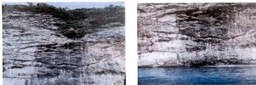
Fotografije obale na mjestu ulivanja potoka u more