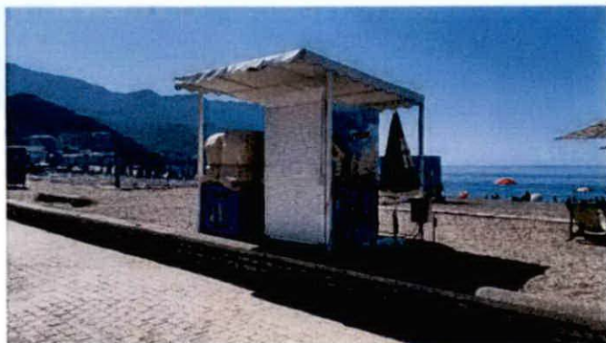
Fotografija sa lica mjesta

Atlasom Crnogorskih plaža i kupališta u opštini Budva za period 2019-2023 god. na kupalištu br. 14D nije predviđeno postavljanje predmetnog sadržaja već samo konzervator za sladoled u industrikoj ambalazi.