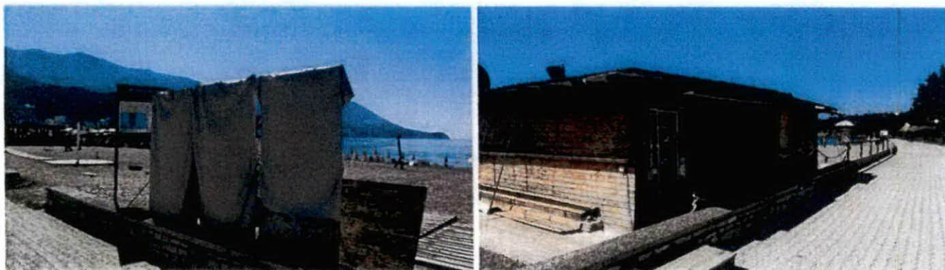
Fotografije sa lica mjesta

Izmjenom i dopunom Programa objekata privremenog karaktera u zoni morskog dobra u opštini Budva za period 2019-2023. godine, na lokaciji br.9.4 nije predviđeno postavljanje predmetnog sadržaja već je isti postavljen bez odobrenja i suprotno izdatim UT. uslovima.