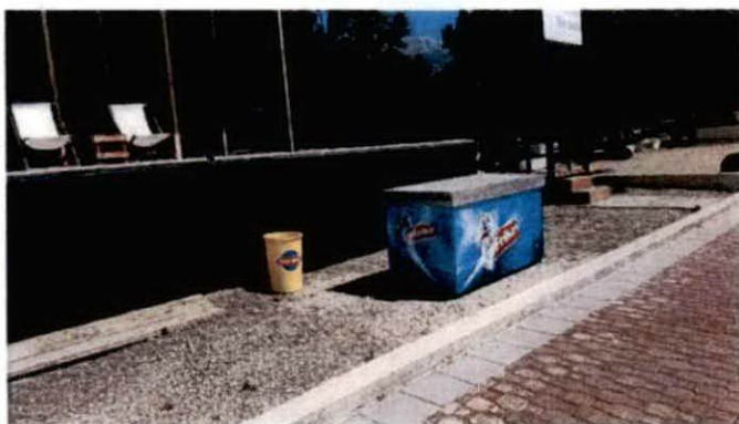
Fotografija sa lica mjesta

Izmjenom i dopunom programa objekata priv. karaktera u zoni morskog dobra u opštini Budva za period 2019-2020. godine na navedenoj lokaciji nije predviđeno postavljanje predmetnog sadržaja već je isti postavljen bez odobrenja i dozvole.