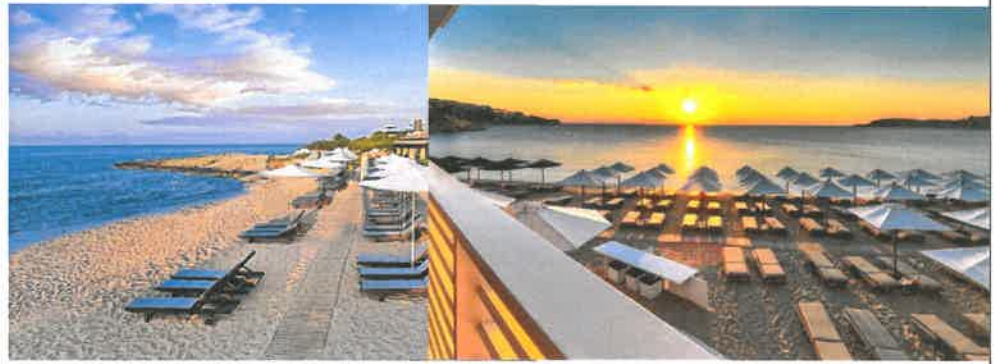
Slike: Primjeri uređenja kupališta

Plažni mobilijar (suncobrani/ležaljke/baldahini) koji se postavlja na kupalištu, kao i ostala oprema koja je u funkciji kupališta (kabine za presvlačenje i dr.) može biti samo u pastelnim bojama (bijela, bež i dr. ), a nikako sa reklamnim natpisima.