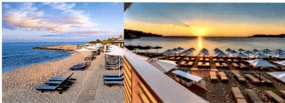
Slike: Primjeri uređenja kupališta

Plažni mobilijar (suncobrani/ležaljke/baldahini) koji se postavlja na kupalištu, kao i ostala oprema koja je u funkciji kupališta (kabine za presvlačenje i dr.) može biti samo u pastelnim bojama (bijela, bež i dr. ), a nikako sa reklamnim natpisima.