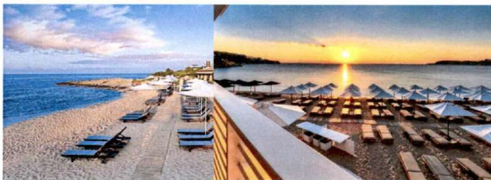
Slike: Primjeri uređenja kupališta

Ležaljke se izrađuju od PVC materijala, drveta i ostalih lakih materijala, a baldahini se izrađuju od drvene konstrukcije površine do 2 x 2.5 m, natkrivene bijelim platnom i zavjesama.