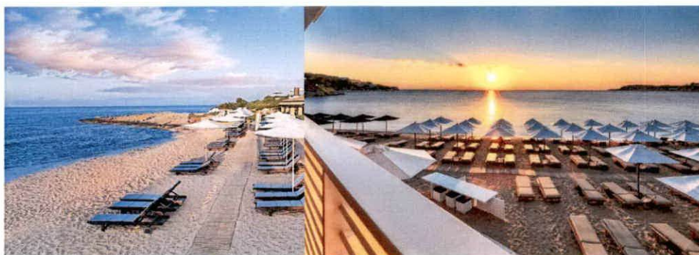
Slike: Primjeri uređenja kupališta

Ležaljke se izrađuju od PVC materijala, drveta i ostalih lakih materijala, a baldahini se izrađuju od drvene konstrukcije površine do 2 x 2.5 m, natkrivene bijelim platnom i zavjesama.