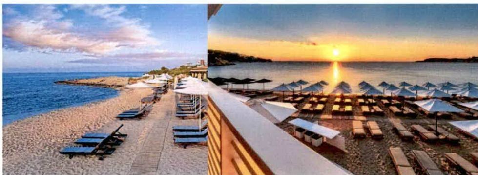
Slike: Primjeri uređenja kupališta

Ležaljke se izrađuju od PVC materijala, drveta i ostalih lakih materijala, a baldahini se izrađuju od drvene konstrukcije površine do 2 x 2.5 m, natkrivene bijelim platnom i zavjesama.