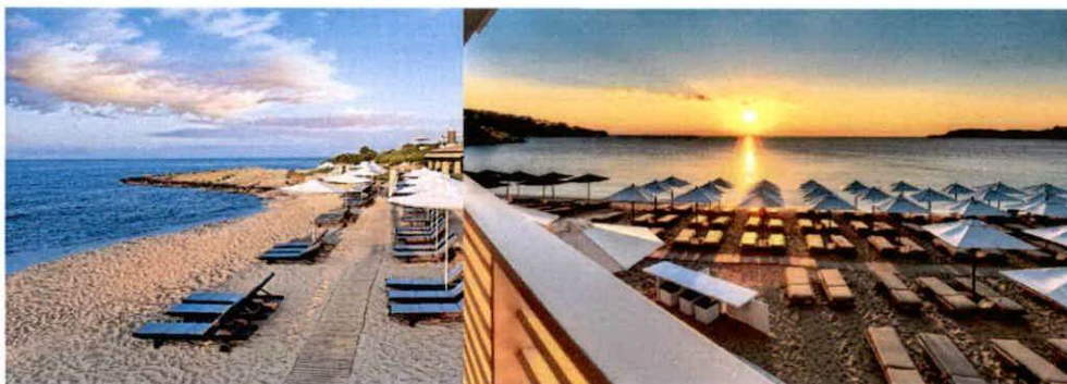
Slike: Primjeri uređenja kupališta

Plažni mobilijar (suncobrani/ležaljke/baldahini) koji se postavlja na kupalištu, kao i ostala oprema koja je u funkciji kupališta (kabine za presvlačenje i dr.) može biti samo u pastelnim bojama (bijela, bež i dr. ), a nikako sa reklamnim natpisima.