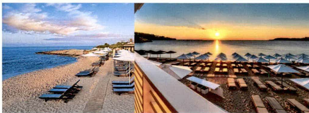
Slike: Primjeri uređenja kupališta

Plažni mobilijar (suncobrani/ležaljke/baldahini) koji se postavlja na kupalištu, kao i ostala oprema koja je u funkciji kupališta (kabine za presvlačenje i dr.) može biti samo u pastelnim bojama (bijela, bež i dr. ), a nikako sa reklamnim natpisima.