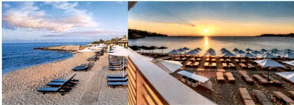
Slike: Primjeri uređenja kupališta

Plažni mobilijar (suncobrani/ležaljke/baldahini) koji se postavlja na kupalištu, kao i ostala oprema koja je u funkciji kupališta (kabine za presvlačenje i dr.) može biti samo u pastelnim bojama (bijela, bež i dr. ), a nikako sa reklamnim natpisima.