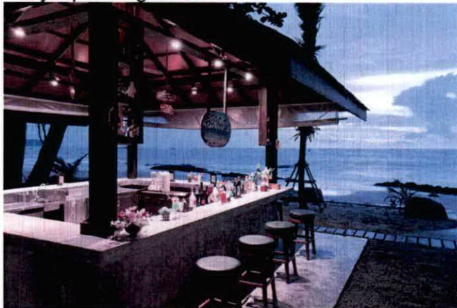
Primjer plažnog bara

-Postavljanje uređaja za hlađenje i zagrijavanje terase električnom energijom vrši se u skladu sa posebnim propisima koji se odnose na električne i termotehničke instalacije.