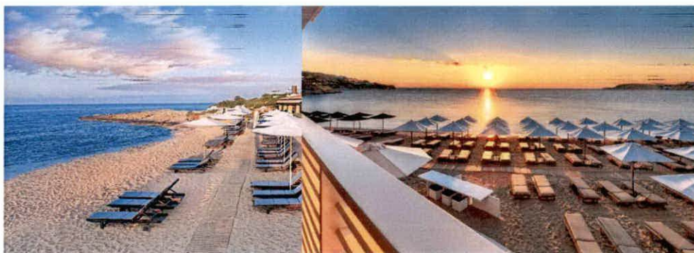
Slike: Primjeri uređenja kupališta

Režim korištenja opreme na plaži, površina kupališta koja mora biti oslobođena od plažne opreme (stočici, kante za otpatke i dr.), dakle slobodni prostor s jedne i raspored odobrene količine plažne opreme u prostoru s druge strane utvrđuje se Ugovorom o zakupu, u odnosu na režim kupališta (hotelsko, javno, gradsko, specijalno itd).