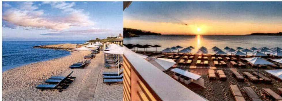
Slike: Primjeri uređenja kupališta

Ležaljke se izrađuju od PVC materijala, drveta i ostalih lakih materijala, a baldahini se izrađuju od drvene konstrukcije površine do 2 x 2.5 m, natkrivene bijelim platnom i zavjesama.