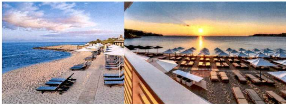
Slike: Primjeri uređenja kupališta

Ležaljke se izrađuju od PVC materijala, drveta i ostalih lakih materijala, a baldahini se izrađuju od drvene konstrukcije površine do 2 x 2.5 m, natkrivene bijelim platnom i zavjesama.