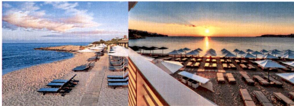
Slike: Primjeri uređenja kupališta

Plažni mobilijar (suncobrani/ležaljke/baldahini) koji se postavlja na kupalištu, kao i ostala oprema koja je u funkciji kupališta (kabine za presvlačenje i dr.) može biti samo u pastelnim bojama (bijela, bež i dr. ), a nikako sa reklamnim natpisima.