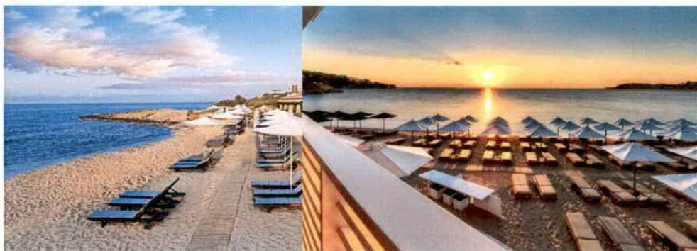
Slike: Primjeri uređenja kupališta

Plažni mobilijar (suncobrani/ležaljke/baldahini) koji se postavlja na kupalištu, kao i ostala oprema koja je u funkciji kupališta (kabine za presvlačenje i dr.) može biti samo u pastelnim bojama (bijela, bež i dr. ), a nikako sa reklamnim natpisima.