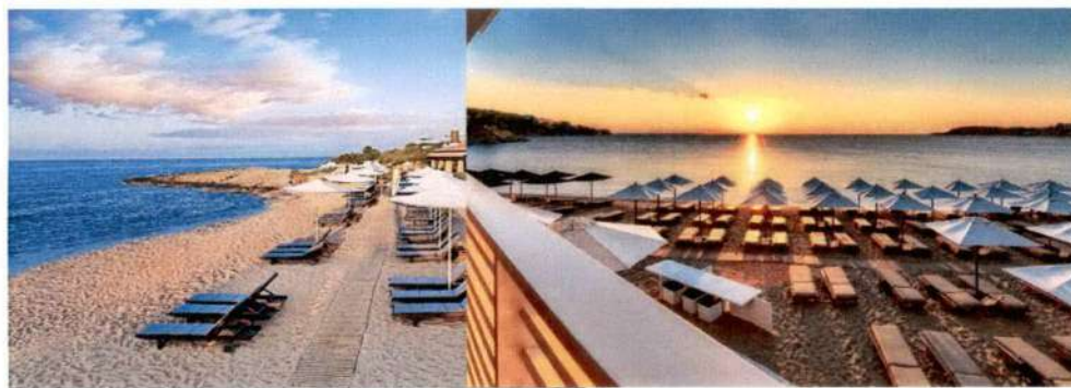
Slike: Primjeri uređenja kupališta

Plažni mobilijar (suncobrani/ležaljke/baldahini) koji se postavlja na kupalištu, kao i ostala oprema koja je u funkciji kupališta (kabine za presvlačenje i dr.) može biti samo u pastelnim bojama (bijela, bež i dr. ), a nikako sa reklamnim natpisima.