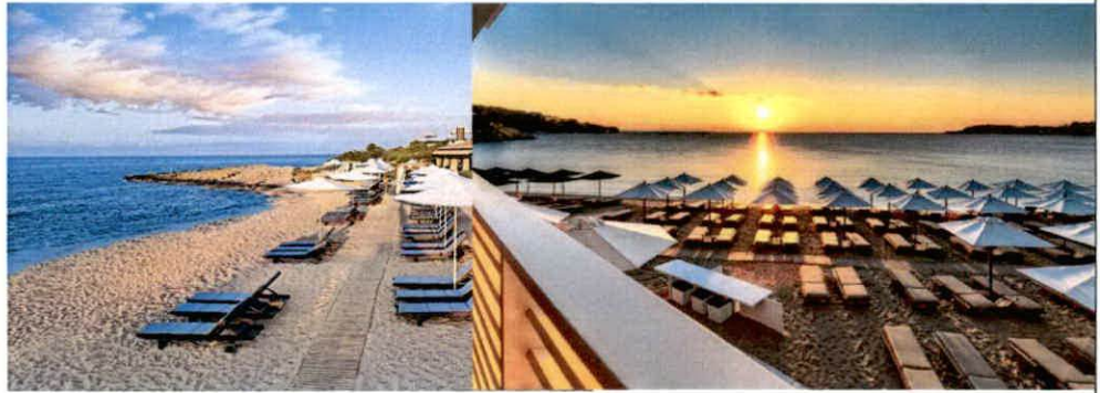
Slike: Primjeri uređenja kupališta

baldahini se izrađuju od drvene konstrukcije površine do 2 x 2.5 m, natkrivene bijelim platnom i zavjesama.