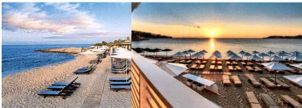
Slike: Primjeri uređenja kupališta

Plažni mobilijar (suncobrani/ležaljke/baldahini) koji se postavlja na kupalištu, kao i ostala oprema koja je u funkciji kupališta (kabine za presvlačenje i dr.) može biti samo u pastelnim bojama (bijela, bež i dr. ), a nikako sa reklamnim natpisima.