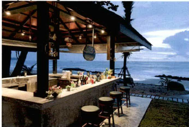
Primjer plažnog bara

-Postavljanje uređaja za hlađenje i zagrijavanje terase električnom energijom vrši se u skladu sa posebnim propisima koji se odnose na električne i termotehničke instalacije.