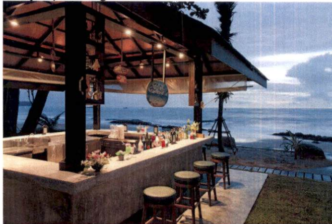
Primjer plažnog bara

-Postavljanje uređaja za hlađenje i zagrijavanje terase električnom energijom vrši se u skladu sa posebnim propisima koji se odnose na električne i termotehničke instalacije.