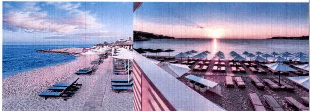
Slike: Primjeri uređenja kupališta

Ležaljke se izrađuju od PVC materijala, drveta i ostalih lakih materijala, a baldahini se izrađuju od drvene konstrukcije površine do 2 x 2.5 m, natkrivene bijelim platnom i zavjesama.