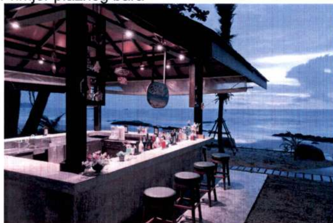
Primjer plažnog bara

-Postavljanje uređaja za hlađenje i zagrijavanje terase električnom energijom vrši se u skladu sa posebnim propisima koji se odnose na električne i termotehničke instalacije.