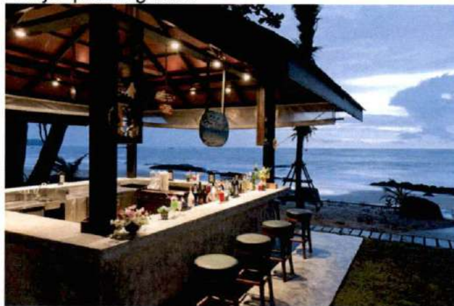
Primjer plažnog bara

-Postavljanje uređaja za hlađenje i zagrijavanje terase električnom energijom vrši se u skladu sa posebnim propisima koji se odnose na električne i termotehničke instalacije.