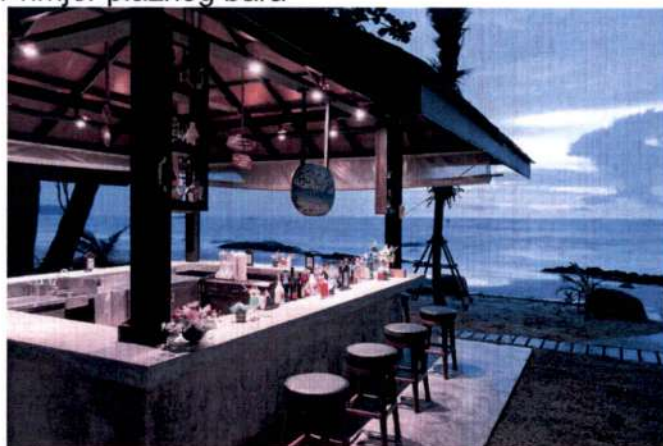
Primjer plažnog bara

-Postavljanje uređaja za hlađenje i zagrijavanje terase električnom energijom vrši se u skladu sa posebnim propisima koji se odnose na električne i termotehničke instalacije.