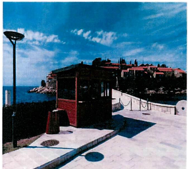
Fotografije sa lica mjesta