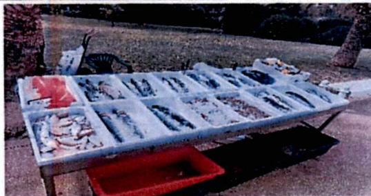
Fotografije sa lica mjesta.