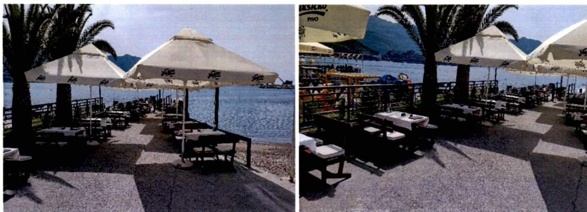
Fotografije sa lica mjesta:

Važećim programom privremenih objekata u zoni morskog dobra u opštini Budva za period 2019-2023. godine na lokaciji broj 5.19 predviđena je terasa na pristaništu površine 45m 2 postavljena uz zapadni dio pristaništa.