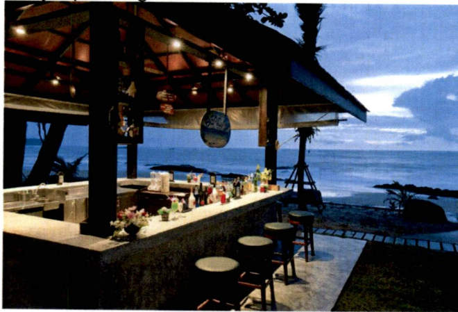
Primjer plažnog bara

-Način postavljanja ove vrste privremenih objekata je montiranje na licu mjesta od već napravljenih elemenata konstrukcije, elemenata krova, demontažnih elemenata vertikalnih pregrada (staklo, leksan, lim, tegola i drugo), demontažne podne platforme. Na isti način se vrši i demontaža.