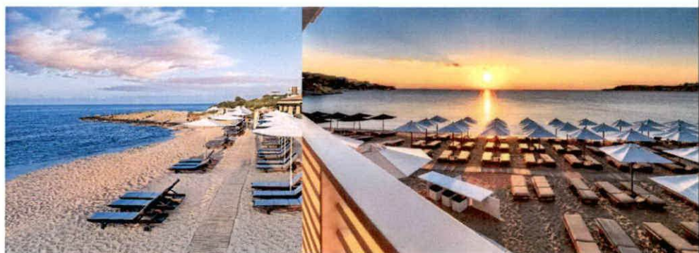
Slike: Primjeri uređenja kupališta

Ležaljke se izrađuju od PVC materijala, drveta i ostalih lakih materijala, a baldahini se izrađuju od drvene konstrukcije površine do 2 x 2.5 m, natkrivene bijelim platnom i zavjesama.