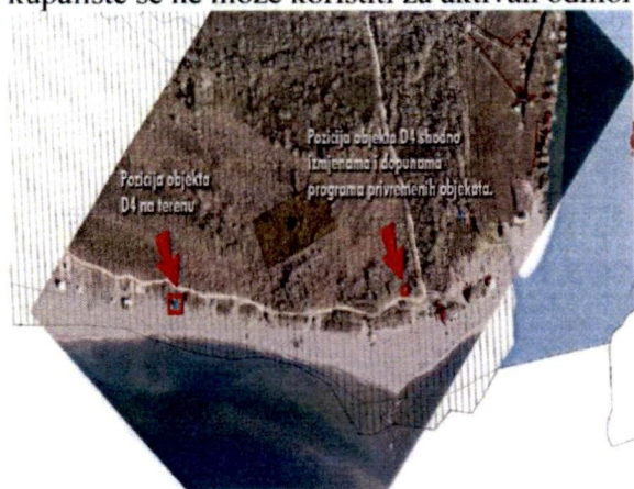
Skica lokacije sa naznačenom postojećom pozicijom objekta D4 i planiranom pozicijom

Po izjavi korisnika, pomenuti objekat onemogućava obavljanje sportskih aktivnosti, tj. kupalište se ne može koristiti za aktivan odmor (kite-wind surfing).