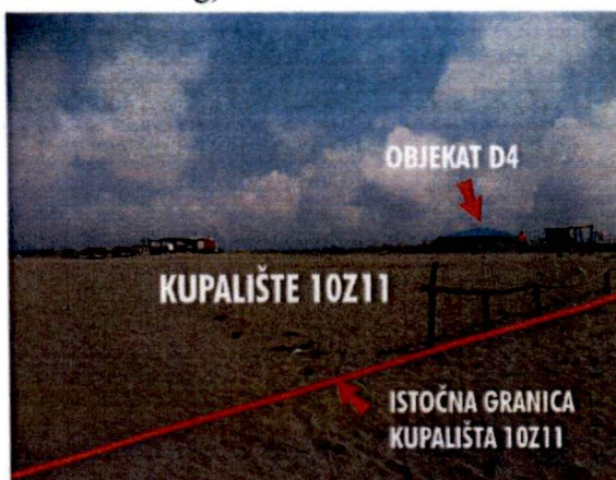
Fotografija zahvata Z11

Potrebno je da se objekat D4 premjesti na prostor koji je predviđen trenutno važećim planom. Zabilješka se dostavlja na dalji postupak.