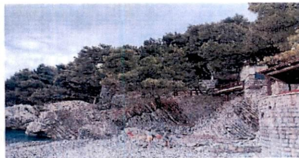
Fotografije sa lica mjesta: