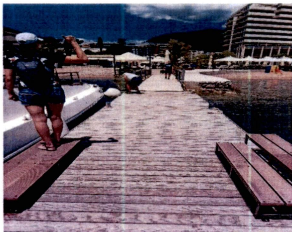
Фотграфје са лица мјеста: