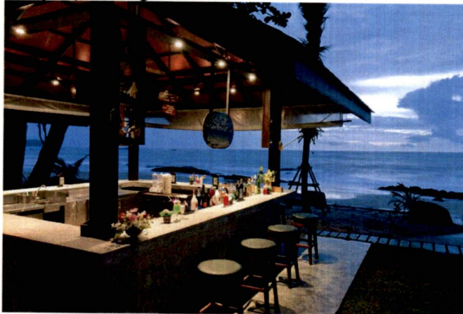
Primjer plažnog bara

-Način postavljanja ove vrste privremenih objekata je montiranje na licu mjesta od već napravljenih elemenata konstrukcije, elemenata krova, demontažnih elemenata vertikalnih pregrada (staklo, leksan, lim, tegola i drugo), demontažne podne platforme. Na isti način se vrši i demontaža.