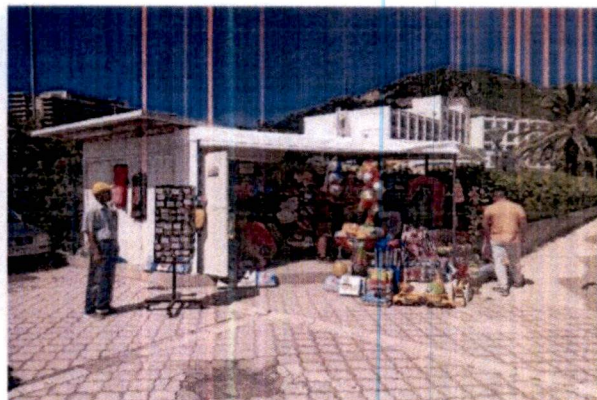
Fotografije sa lica mjesta:

Prilog: Dopis br. 0103-1999/57 od 01.09.2021