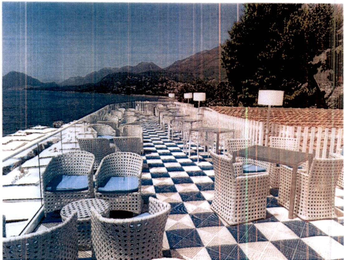
Slika 4 – Izgled krovne terase