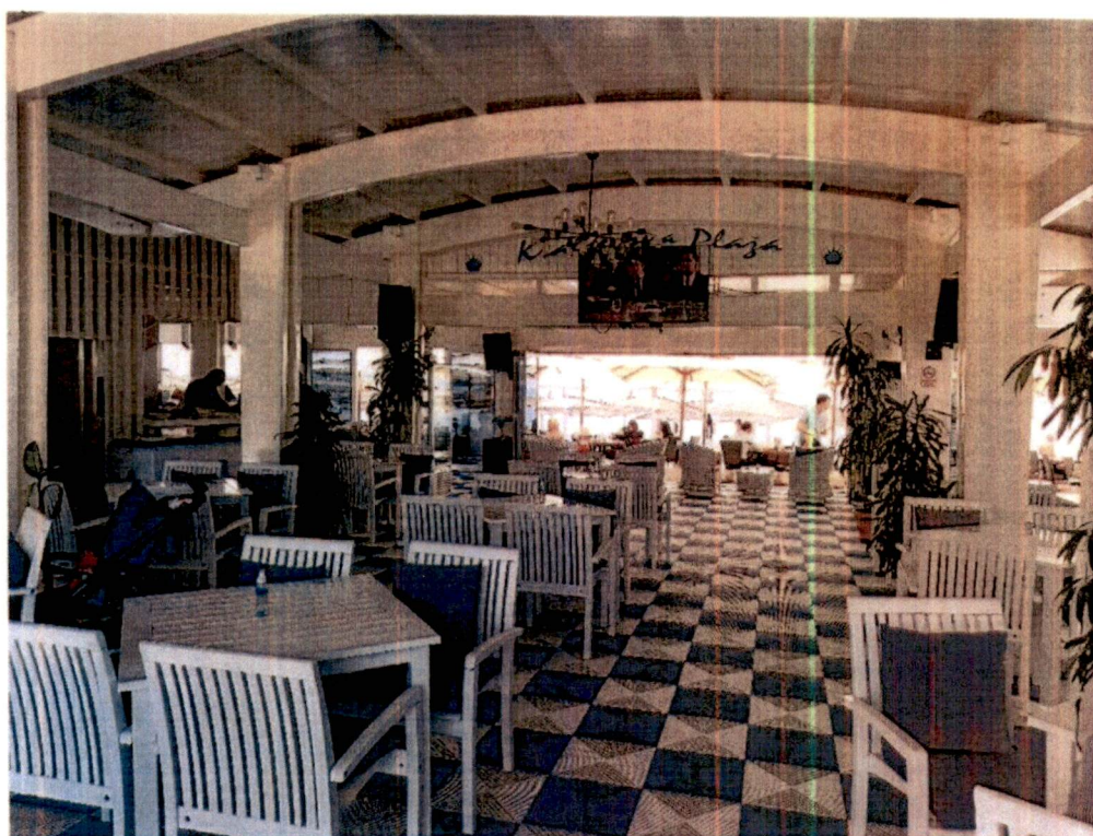
Slika 1 – Izgled zastakljenog dijela objekta