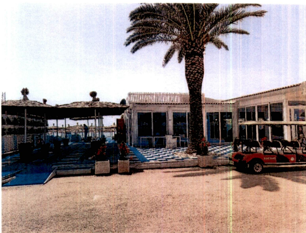
Slika 2 – Izgled zapadne i istočne otvorene terase