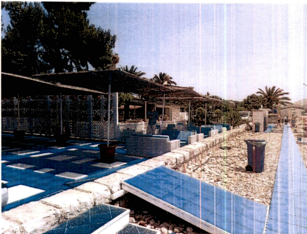
Slika 3 – Izgled terasa iza objekta