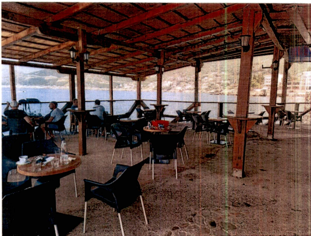
Slika 2 – Izgled natkrivene terase