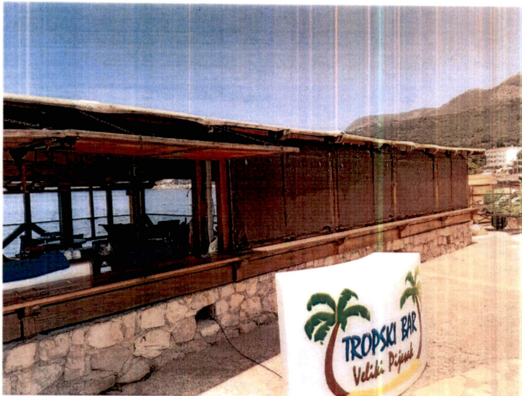
Slika 1 – Izgled šanka