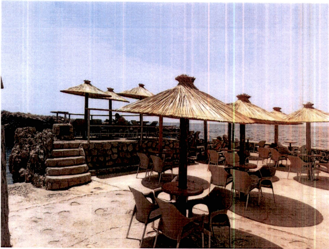
Slika 3 – Izgled otvorenih terasa