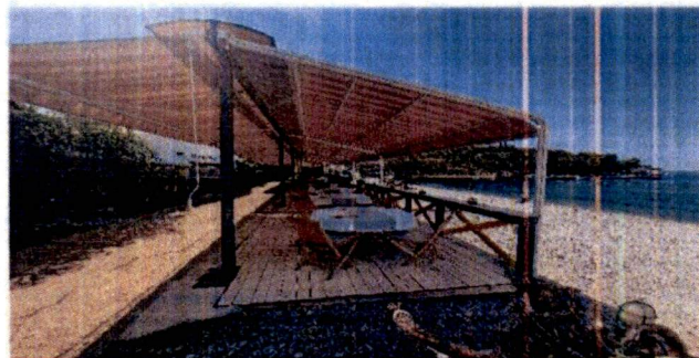
Фотографије са лица мјеста: