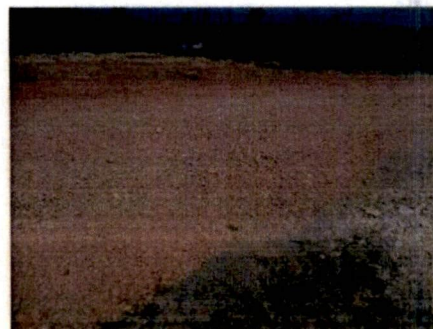
Fotografije od 04.05.2021. godine

U prilogu fotografije sa lica mjesta napravljene u trenutku kontrole od dana 27.07.20201. godine i fotografije od dana 04.05.2021. godine. Zabilješka se dostavlja na dalji postupak.