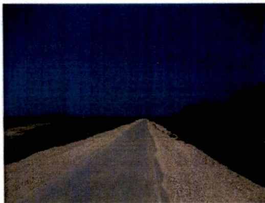
Fotografije od 27.07.2021. godine