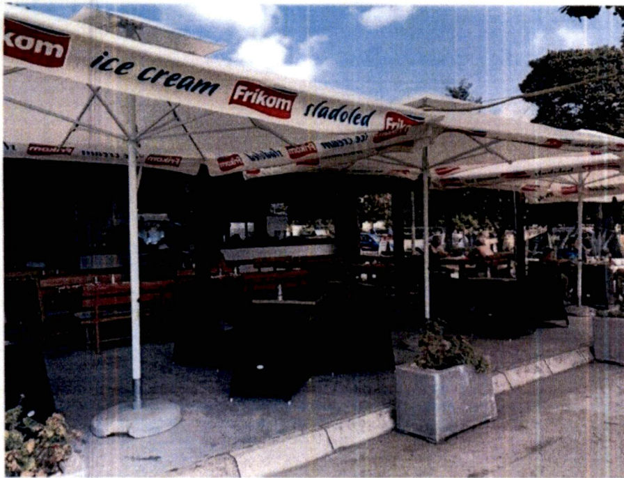
Prilog: list nepokretnosti 2593-prepis