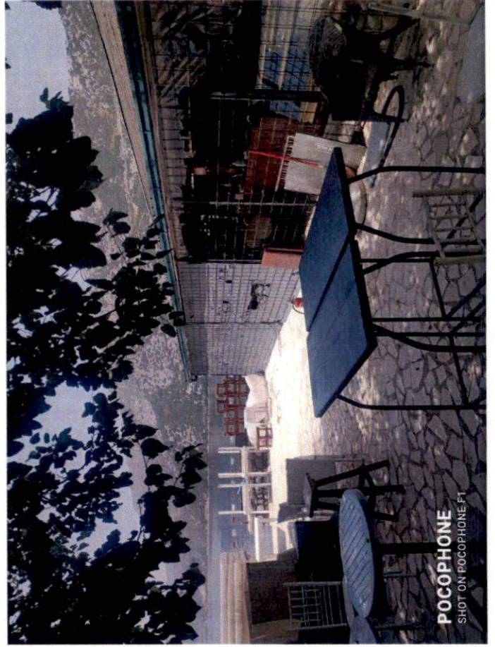
POCOPHONE SHOT ON POCOPHONE 5T