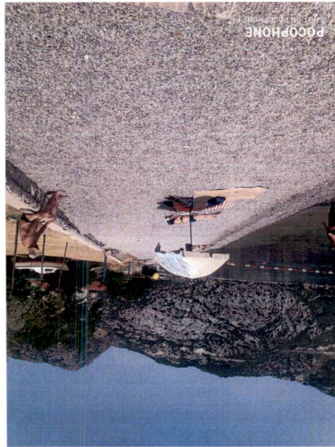
POCOPHONE SHOT ON POCOPHONE 5T