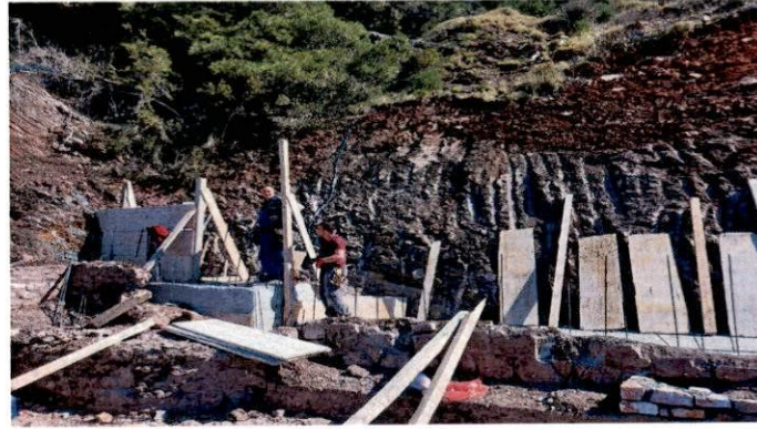
Фотографије са лица мјеста