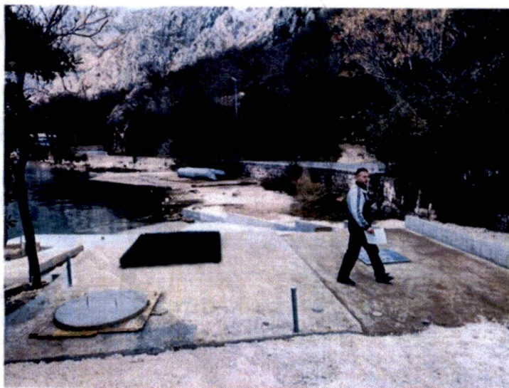
Betoniran plato za postavljanje objekta upojnu jamu