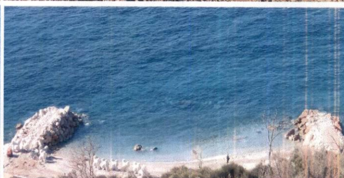
Fotografije sa lica mjesta