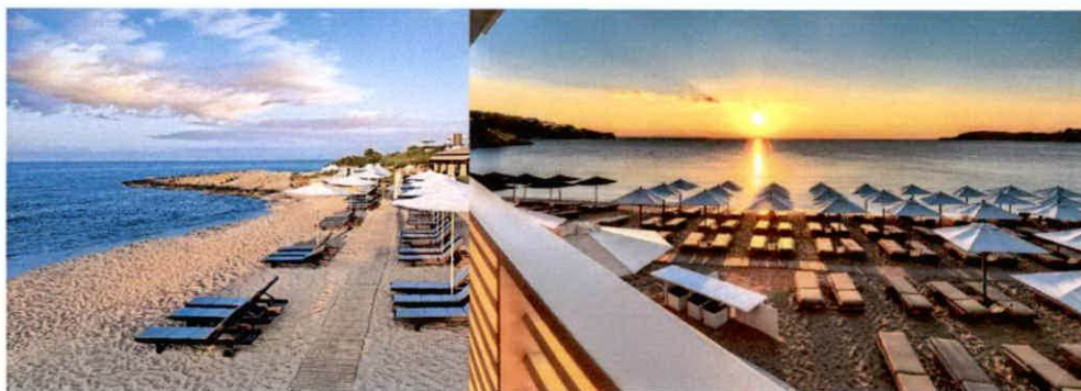
Slike: Primjeri uređenja kupališta

Plažni mobilijar (suncobrani/ležaljke/baldahini) koji se postavlja na kupalištu, kao i ostala oprema koja je u funkciji kupališta (kabine za presvlačenje i dr.) može biti samo u pastelnim bojama (bijela, bež i dr. ), a nikako sa reklamnim natpisima.